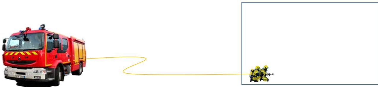
Illustration n°1 : schéma de principe d'établissement d'une ligne d'attaque

Objectif : Etablir une ligne d'attaque à l'aide de tuyaux souples à proximité immédiate du fourgon, pour un sinistre de plain pied ou en étage limité (ex : maison, garage, atelier, appartement au R+1, cave, sous-sol ...).