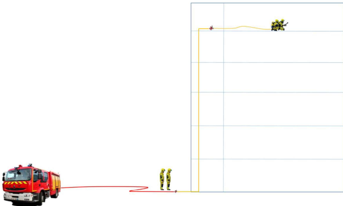
Illustration n°3 : schéma de principe d'établissement d'une lance sur division d'attaque

Objectif : Etablir une ligne d'attaque à l'aide de tuyaux souples sur une division en prolongation d'une division d'alimentation, posée au pied d'un bâtiment pour un sinistre situé au-delà du R+4 (en absence de colonne sèche ou humide).